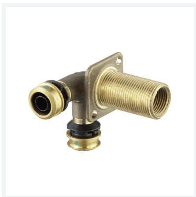
Raxofix-Doppelwanddurchführung mit SC-Contur Modell 5332.4 Artikel 689 582