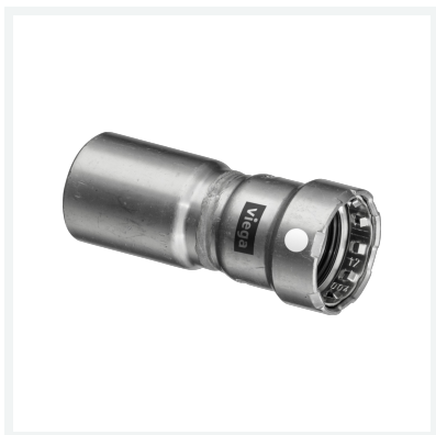
Megapress S-Reduzierstück mit SC-Contur Modell 4315.1 Artikel 799 311