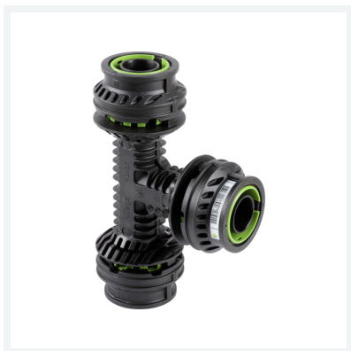
Geopress K-T-Stück mit SC-Contur Modell 9718 Artikel 711 269