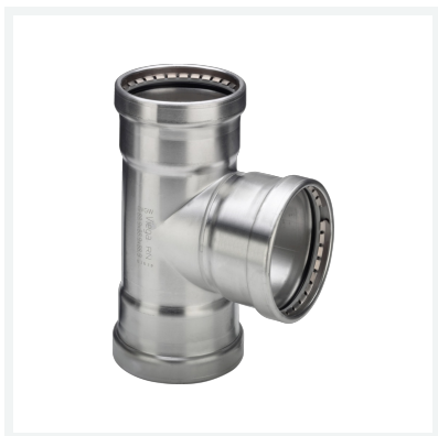
Sanpress Inox XL LF-T-Stück mit SC-Contur labs-frei (Einzelverpackung) Modell 2318XLLF Artikel 665 395