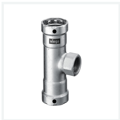
Megapress-T-Stück mit SC-Contur Modell 4217.2 Artikel 695 200