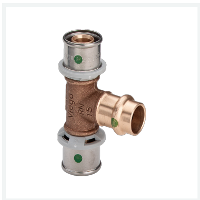
Sanfix P-T-Stück mit SC-Contur Modell 2118.3 Artikel 440 206