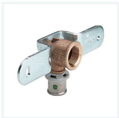
Sanfix P-Montageeinheit mit SC-Contur Modell 2123 Artikel 310 561