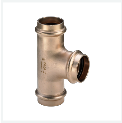
Seapress-T-Stück Modell 0318 Artikel 453 527