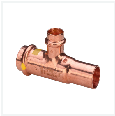
Profipress G-T-Stück mit SC-Contur Modell 2618.1 Artikel 477 363